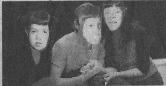
Les trois artistes en résidence.

A terme d'une résidence débutée fin novembre, la compagnie Alise finalise son spectacle Soror , cet après-midi, à l'occasion d'une générale donnée à 17 heures aux Haras. Un spectacle dynamique et abstrait avec trois interprètes,