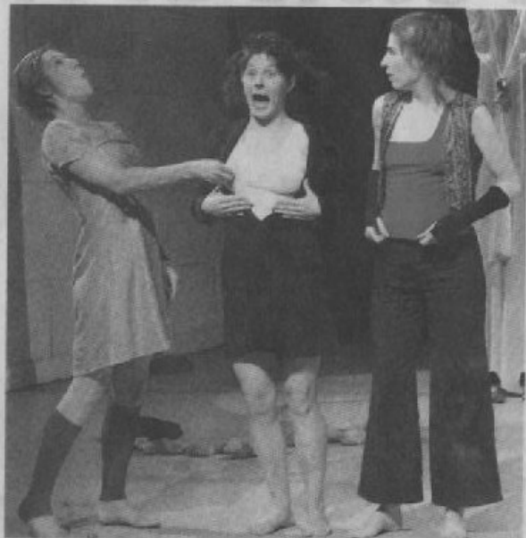
Le trio Alise dans Soror.